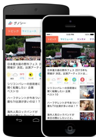
画像はグノシーサービス画面（上） Gunosy コーポレートロゴ（左）、サービスアイコン（右）