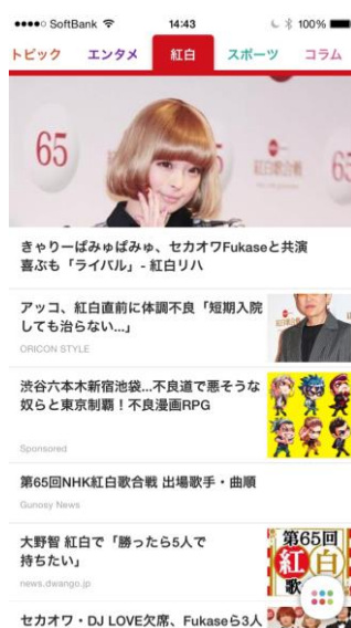
画像：特集タブ画面

本特集タブは、2014年12月31日（水）19時15分～23時45分にかけてNHK総合にて放送される「第65回NHK紅白歌合戦」に関するニュースやコラム等の情報を収集、本日から2015年1月3日にかけてお届けいたします。当タブの情報で、年末の名物番組「紅白」をより一層楽しんでみてはいかがでしょうか。